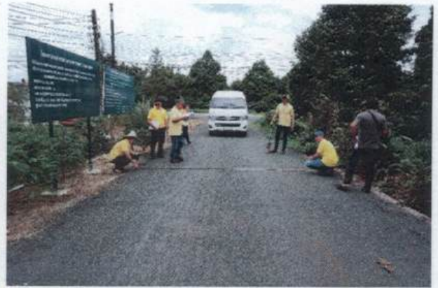
๕. โครงการก่อสร้างถนนคอนกรีตเสริมเหล็ก ขอยดีป्ली ๓ (บ้านลุงปุย) หมู่ที่ ๙ ตำบลเขาวัว อำเภอกำแพงเพชร จังหวัดจันทบุรี (งบประมาณ ๒๙๗,๐๐๐ บาท)