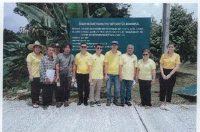
๖. โครงการปรับปรุงผิวจราจรโดยลงแอสฟัลท์ติกคอนกรีตทับหน้าผิวจราจรเดิม ถนนสายบ้านตั้งล่าง- บ้านเขาวัว หมู่ที่ ๒ ตำบลเขาวัว อำเภอกำแพงเพชร จังหวัดจันทบุรี (งบประมาณ ๓,๑๙๘,๙๙๙ บาท)